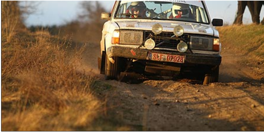
VOLLES HAUS: Der Schotter-Cup erfreut sich weiterhin großer Beliebtheit